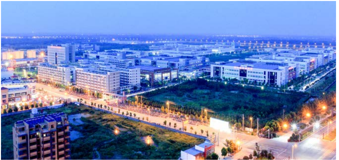
壮观的台企集群景象