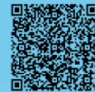
“建行生活”扫描领取100减40优惠券