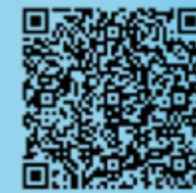
微信扫码注册建行生活